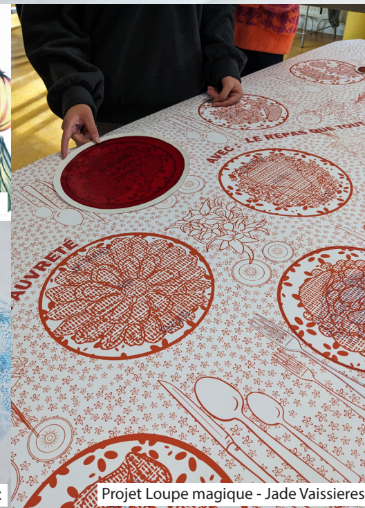
Projet Loupe magique - Jade Vaissieres